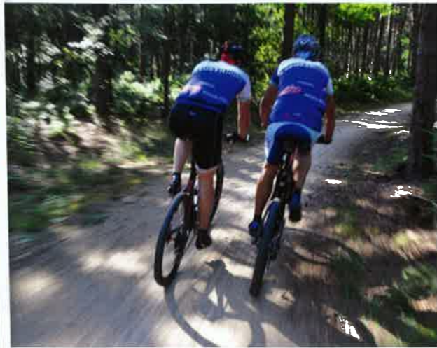
Steile klimmetjes en snelle afdalingen wisselen elkaar af.