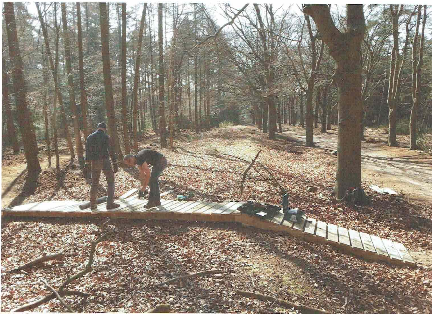
KWETSBARE STUKKEN WORDEN VOORZIEN VAN EEN NORTHSHORE BESCHERMPLAAG

belangrijkste is, is de saamhorigheid die hiermee ontstaat. Iedereen werkt mee aan zijn 'eigen' route, een route die gekoesterd wordt. Er ontstaat sociale controle en mensen zetten zich graag in voor 'hun' route. En dit ontgaat ook de terreinbeheerders niet, die deze inzet van de bikers als zeer positief ervaren. En op die manier winnen we uiteraard allemaal.